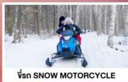
ขี่รถ SNOW MOTORCYCLE