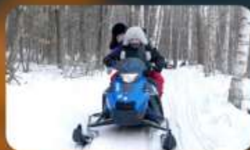
จักรยาน SNOW MOTORCYCLE